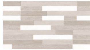
D. BRICK GRIS 33,3x60 13"x24" NATURAL G537 M 2