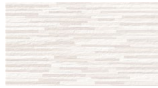
D. AFRICA BLANCO 33,3x60 13"x24" NATURAL G537 M 2