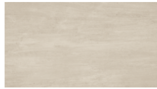
INTENSE GRIS 33,3x60 13"x24" NATURAL G530 R9/C1 PEI III