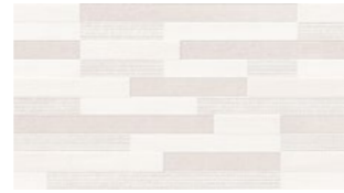
D. BRICK BLANCO 33,3x60 13"x24" NATURAL G537 M 2