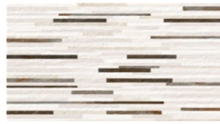
D. AFRICA MARRÓN 33,3x60 13"x24" NATURAL G537 M 2