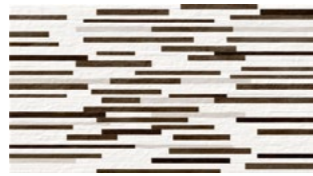
D. AFRICA NEGRO 33,3x60 13"x24" NATURAL G537 M 2