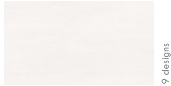
INTENSE BLANCO 33,3x60 13"x24" NATURAL G530 R9/C1 PEI IV