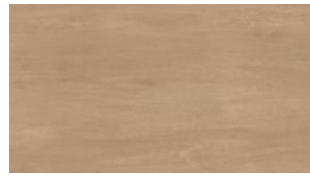
INTENSE CAFE 33,3x60 13"x24" NATURAL G530 R9/C1 PEI II