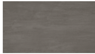
INTENSE NEGRO 33,3x60 13"x24" NATURAL G530 R9/C1 PEI II