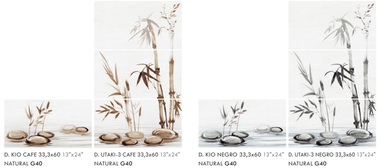
D. KIO CAFE 33,3x60 13"x24" NATURAL G40